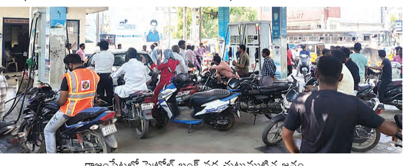
రాజంపేటలో పెట్రోల్ బంక్ వద్ద చుట్టుముట్టిన జనం

అవసరం లేకపోయినా భారీగా కొనుగోలు అందుకే పెట్రోల్, డీజిల్ డిమాండ్ యుద్ధం సమయంలో కూడా ఇలాంటి పరిస్థితి లేదు..!