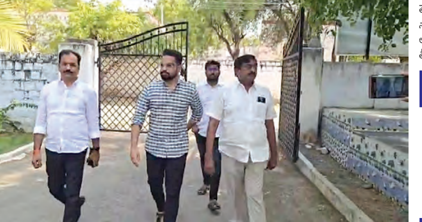
డిఎస్సీ కార్యాలయానికి విచారణకు వస్తున్న భార్యపరెడ్డి