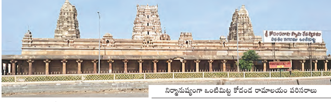
నిర్మాణపు గాంధీ ఒంటిమిట్ట కోడండ రామాలయం పరిసరాలు

భయంతో ఇళ్లలోనే జనం... తప్పనిసరిగా జాగ్రత్తలు పాటించాలని వాతావరణశాఖ వార్తాని